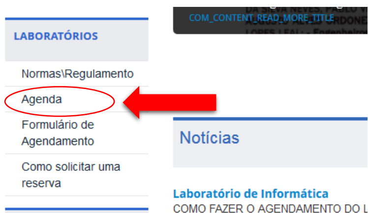
Figura 1 - Verifica a Disponibilidade do Laboratório

1 – Acesse no menu lateral a opção Laboratórios → Agenda, como na imagem a seguir, para verificar a disponibilidade dos horários do Laboratório: